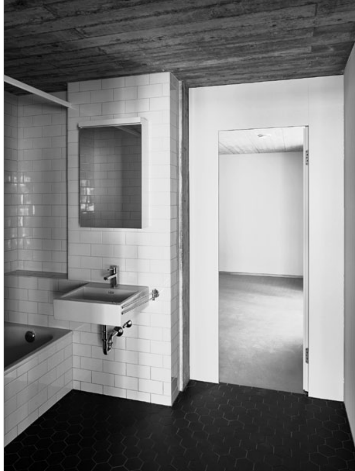
Zweite Wege: Zugang zum Schlaf- zimmer über das Bad.