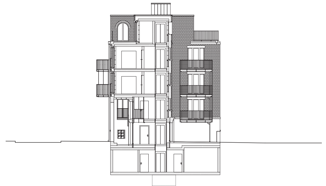
← Ansichten Längsseiten Hof und Oberwiesenstrasse M 1:250.