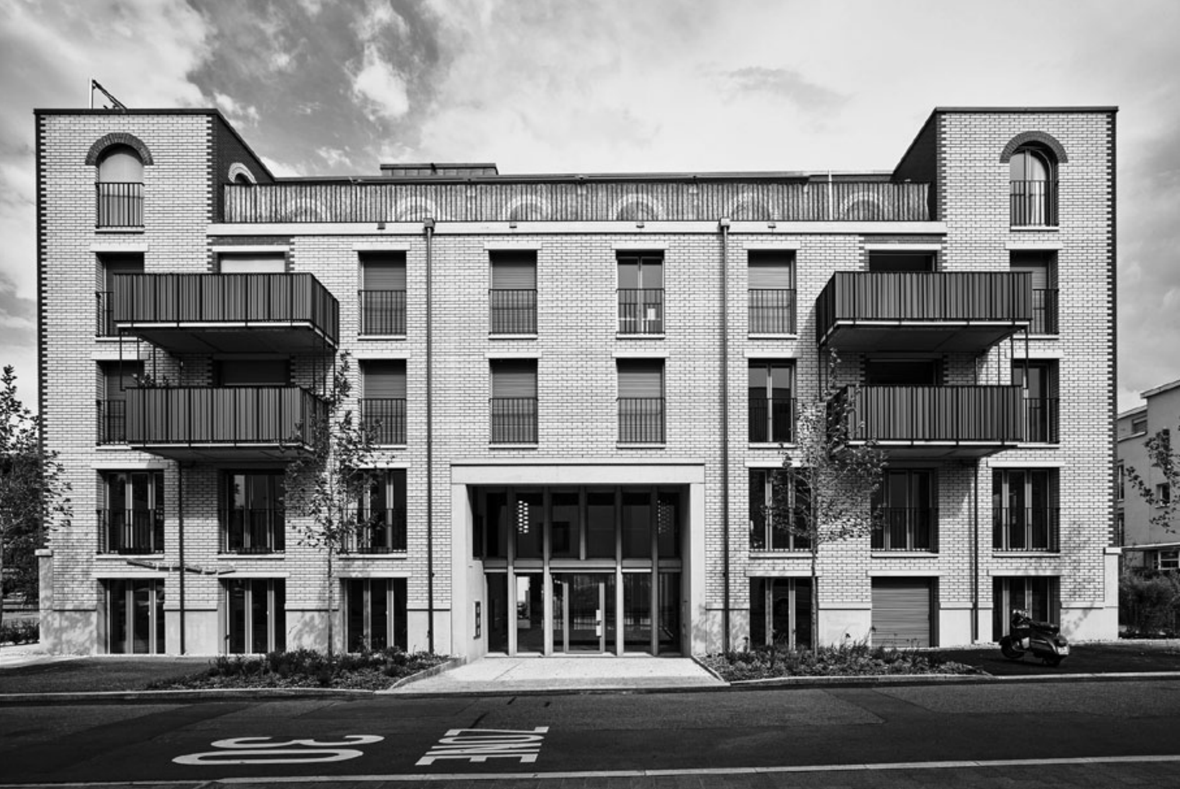
Ansicht Oberwiesenstrasse: ein städtisches Wohnhaus.