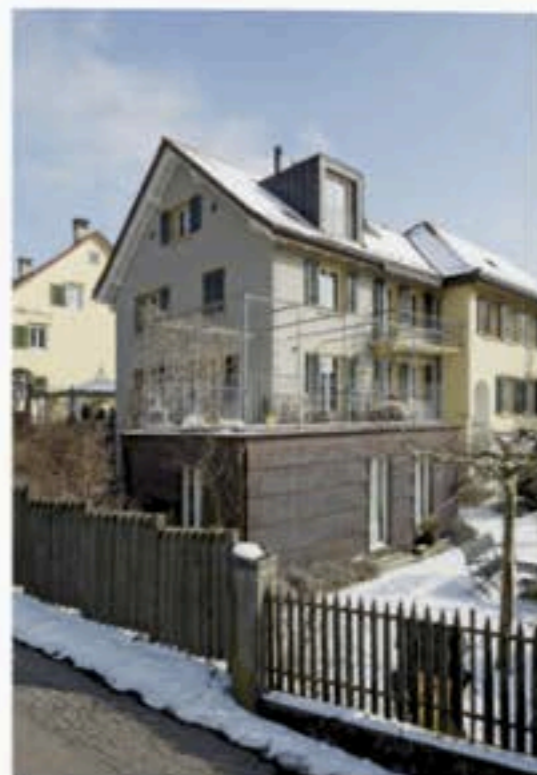
La façade sud-ouest.